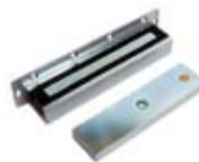
Влагозащищенные замки для условий холодного климата AL-180FB / AL-350FB