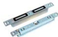
Сдвиговые врезные замки AL-250S / AL-400S / AL-500S