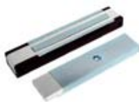
Замки класса Premium AL-150PR / AL-200PR / AL-300PR / AL-400PR